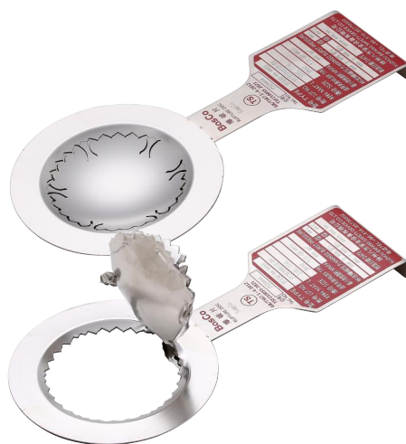
YF爆破片爆破前和爆破后