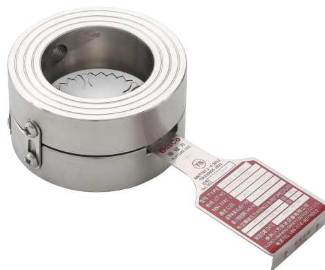
YF系列爆破片安装在YJ系列爆破片夹持器中